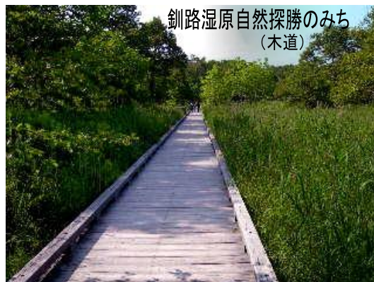
釧路湿原自然探勝のみち (木道)