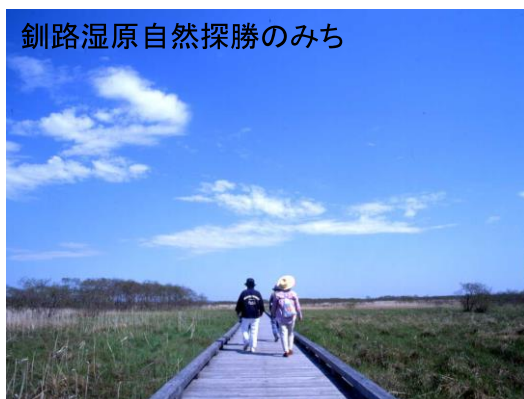
釧路湿原自然探勝のみち