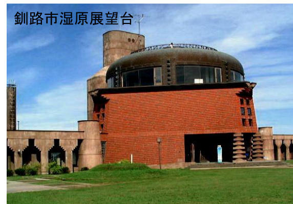
釧路市湿原展望台

協賛 釧路市観光振興室 一般社団法人 釧路観光コンベンション協会 お問い合わせ 阿寒バス株式会社 TEL0154-37-2221