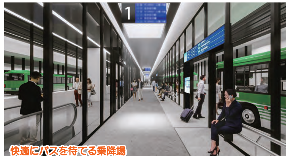
快適にバスを待てる乗降場

※建物外観や形状、内部レイアウト等はイメージであり、実態と異なる場合があります。