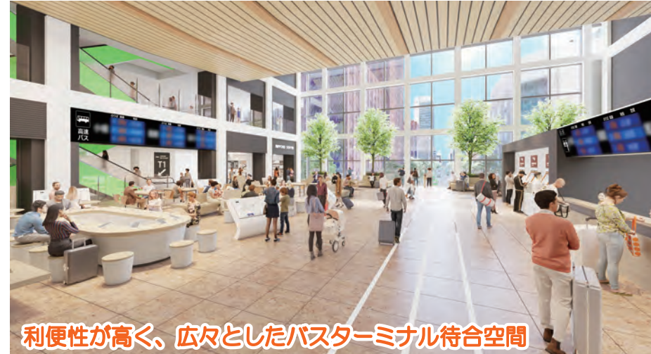
利便性が高く、広々としたバスターミナル待合空間