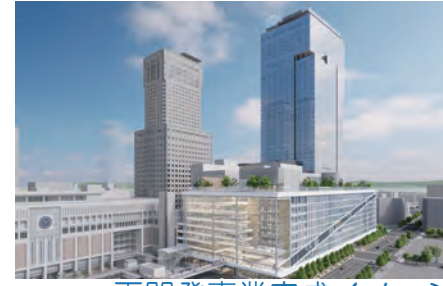
再開発事業完成イメージ

◆北海道新幹線札幌開業、札幌駅周辺の開発を見据え、道都札幌の玄関口にふさわしい空間形成と、高次都市機能・交通結節機能の強化を目指します。