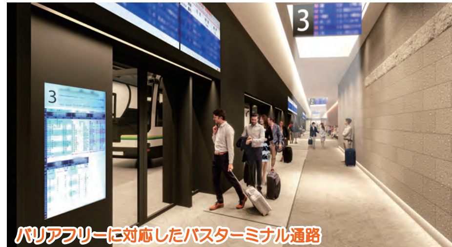
バリアフリーに対応したバスターミナル通路